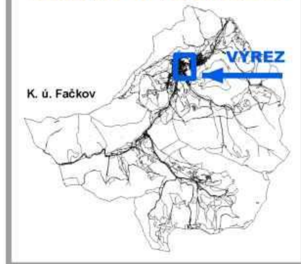
SCHÉMA VÝREZU VÝKRESU