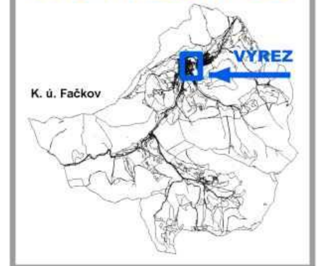
SCHÉMA VÝREZU VÝKRESU